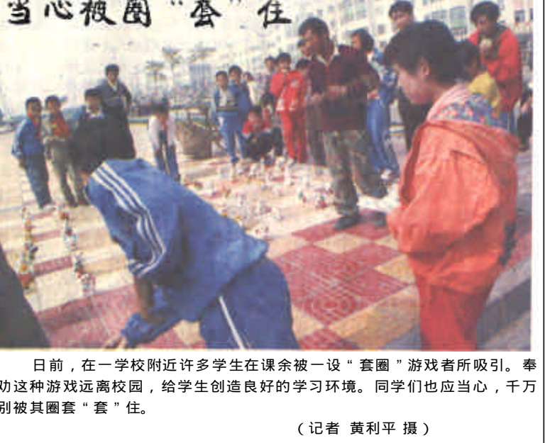
日前，在一学校附近许多学生在课余时间被一设“套圈”游戏所吸引。奉劝这种游戏远离校园，给学生创造良好的学习环境。同学们也应当心，千万别被其圈套“套”住。

本报讯 近日，由我市新闻出版、公安、工商、质量技术监督、文化市场管理等部门联合进行的整顿和规范印刷市场秩序工作已经全面展开。本次清理整顿将以国务院颁布的《印刷业管理条例》等法规为依据，按照压缩总量、优化结构、加强监管、严格规范的要求，坚持打击与防范、整顿与规范、扶优与治劣相结合的原则，以区县为单位对印刷市场秩序进行整顿与规范，促进印刷业健康有序发展。此次清理整顿工作自今年10月份开始，到2002年2月结束。据有关部门的负责人介绍，这次整顿规范工作的具体目标是：取缔无证无照的印刷厂点；严肃查处违法违规印刷行为；抓好重点区域的整治；压缩不符合条件的印刷企业。在摸清全市印刷企业底数的基础上，有关部门将对印刷企业进行认真清查，重点检查和核实以下五个方面的内容：印刷企业是否具备开办条件，证照是否齐全；从事印刷经营的业务范围是否合法，印刷手续是否齐备、管理制度是否健全、产品产量是否符合标准；有无印制政治性非法出版物以及国家明令禁止印制的其他内容的出版物；有无印制假证件、假冒侵权商标标识、冒用和仿造的产品质量标识、虚假广告和仿冒他人包装装潢印刷品；有无印制侵权盗版及其他违法违规印刷行为等。各区县将根据清查核实的情况，提出本区县保留、取缔、整合压缩、查处等方面的具体意见，并逐级上报，最终由有关部门作出相关处理。（本报记者 薄文军）