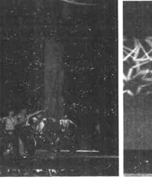
图为山东歌舞剧院的演员们为环卫工人表演精彩的文艺节目